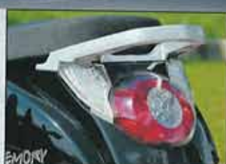
Heck mit LED-Lichtern