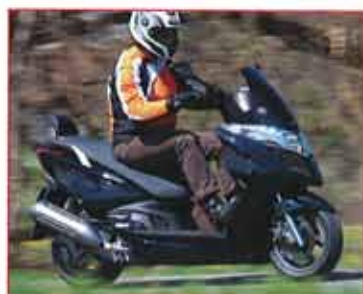
Kymco Grand Dink 125i