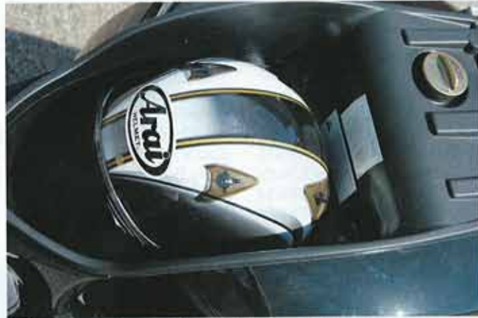
Helmloch praxistauglich, auch kleinere Integralos passen