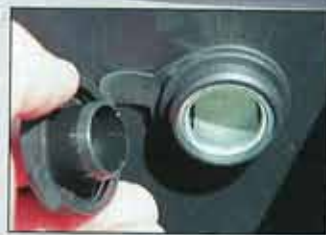
12 V-Steckdose an Bord