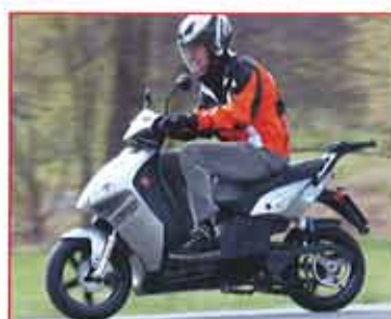
Govecs 3.4 Elektro