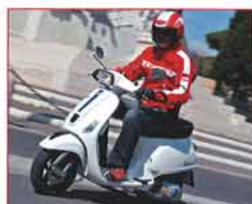
Neuer Motor: Vespa SILX 125