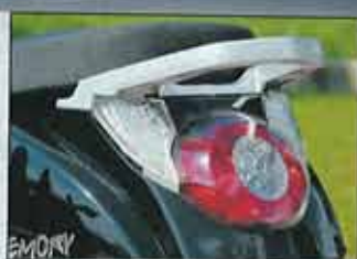
Heck mit LED-Lichtern