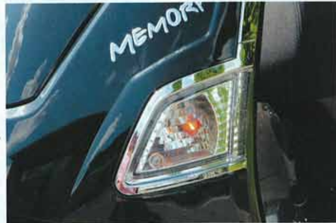
Chrom tut gut, unterstreicht den wertigen Aspekt