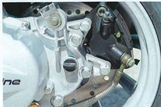
Scheibenbremse auch hinten, eine saubere Konstruktion