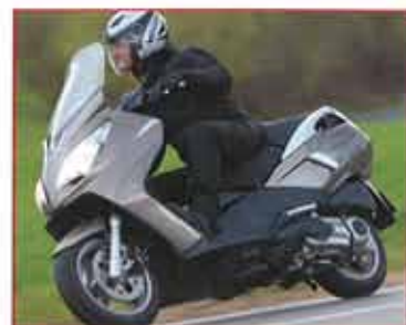
Peugeot Satelis II 125